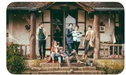
LES LENDEMAINS DE VEILLE CINÉ RENCONTRE

Un film d'Olivier Dahan (la même) avec Elsa Zylberstein et Rebecca Marder.